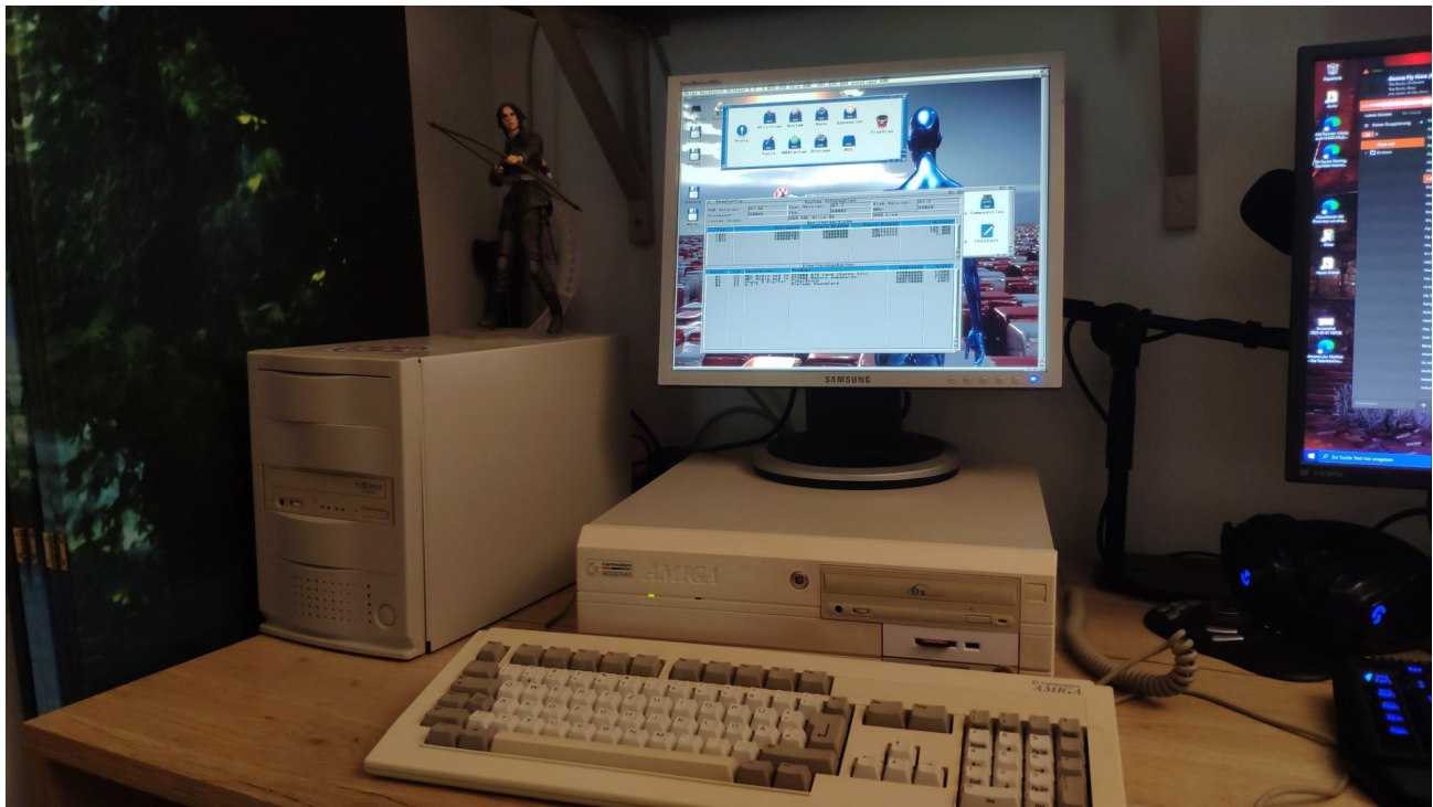
Bild von oben gespeichert, in Paint um 180 Grad gedreht und gespeichert. Bild steht also gespeichert auf dem Kopf - dann hier eingefügt, et voila: die Forumsoftware dreht es erneut um 180 Grad und wir sehen es nun korrekt 😊