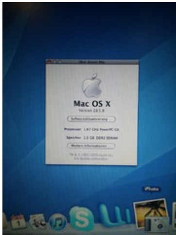
Powerbook G4 Titanium: