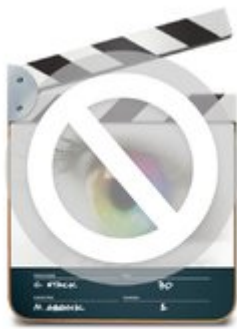
Final Cut Express.app Programm - 246,8 MB Erstellt: 7. November 2007 um 00:15 Version: 4.0.1 Mehr anzeigen

MPEGStreamclip und QuickTimePlayer7 läuft problemlos unter Mojave. Final Cut Express lässt sich erstaunlicherweise unter Mojave installieren (hierbei wird sogar der Part übersprungen, bei dem die Lizenzdaten einzugeben sind) – startet aber nicht.